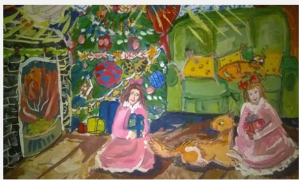
Афонасьева Ксения «Ночь перед Рождеством. В ожидании чуда» Лицей «Созвездие» № 131, 2 «Б» класс, живопись.